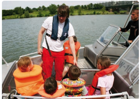
Vor der Fahrt der Wasserratten-Rätsel-Gewinnerinnen und -Gewinner mit dem ÖWR-Boot

serratten-Rätsels eine der beliebten Fahrten mit unserem großen Einsatzboot zu gewinnen.