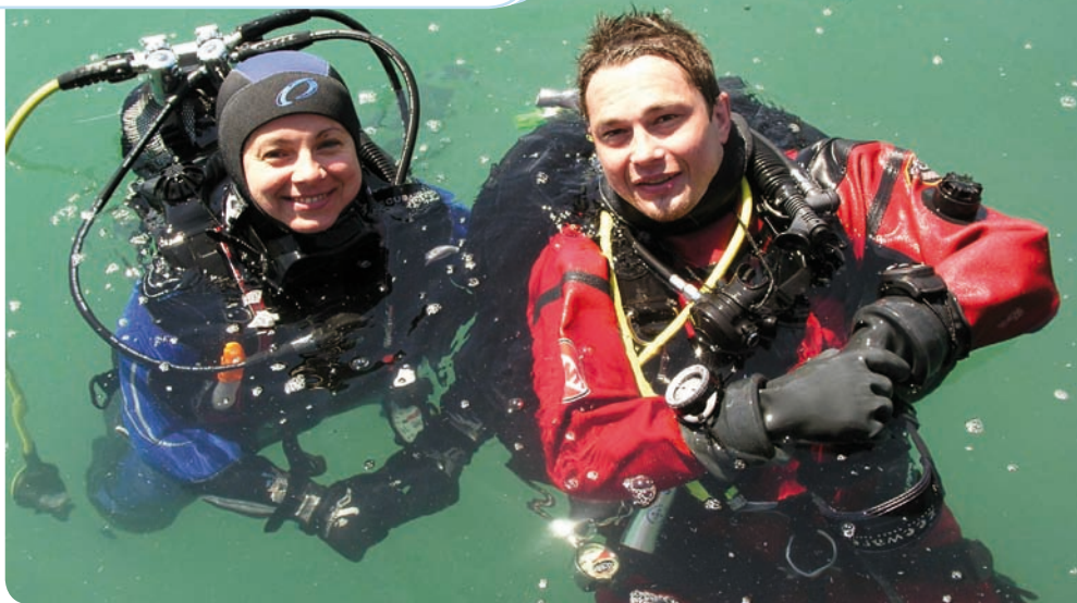
Tauchkurs am Attersee: Entspanntes Lehrer-Schülerinnen-Team