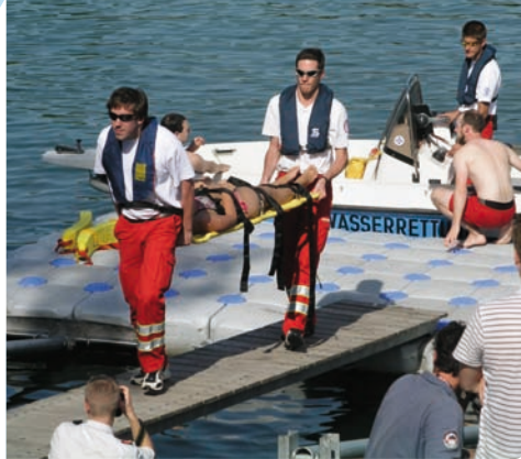
Vorführung: Abtransport eines Wasserunfallopfers

Am Samstag- und Sonntagnachmittag besuchten wieder viele Zuschauer die Einsatzvorführung auf der Neuen Donau. Die Einsatzannahme war wie folgt: Ein mäßig guter Schwimmer chillt Bier trinkend in seinem Schlauchboot und wird von einer jungen badenden Schönheit angegriffen. Die Erwidderung der Annäherungsversuche wirkt sich