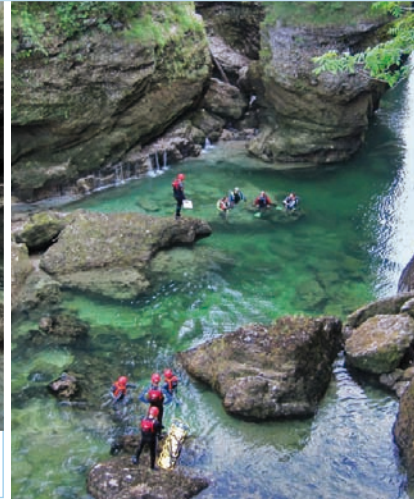
Sucheinsatz von ÖWR-Tauchern aus Oberösterreich und Wien nahe der Traunfälle