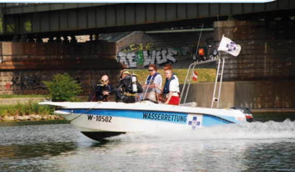
Vorführung: Einsatzbereite Rettungstaucher am ÖWR-Boot