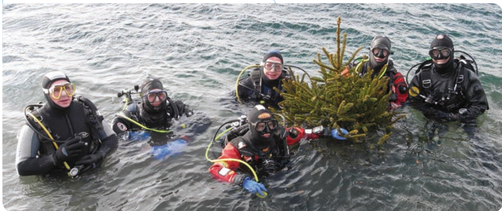
Aufgrund verkühlungsbedingter Ausfälle sehr klein geratene Gruppe des Weihnachtstauchens 2010