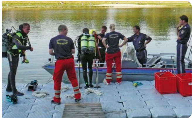
Einsatzvorbereitung der ÖWR-Taucher