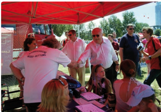
Bürgermeister Dr. Häupl am DIF-Stand der ÖWR

Am Sonntag wurden wir bei bestem Wetter durch unseren Bürgermeister Dr. Michael Häupl am ÖWR-Info-Stand beehrt.