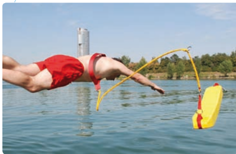
Vorführung am DIF 2010: Sprung eines Rettungsschwimmers mit Gurtretter ins kalte Wasser

negativ auf das Gleichgewicht des Schlauchbootkapitäns aus und er landet zielsicher im Wasser. Da er kein guter Schwimmer ist, klammert er sich an das Ziel seiner Begierde, welches sich heftig gegen die Umklammerung wehrt. Im Laufe der Rangelei geht der junge Mann entkräftet unter. Zwei herbeigerufene Rettungsschwimmer der ÖWR bringen die Frau ans Ufer. Erst dann wird klar, dass noch eine weitere Person vermisst wird. Ein Boot mit Einsatztauchern wird per Funk angefordert und dann von den bereits nach dem Opfer suchenden Rettungsschwimmern eingewiesen. Der junge Mann kann nach einer kurzen Suche von den Tauchern an die Wasseroberfläche gebracht werden. Er wird noch an Bord reanimiert und an Land dem Sanitätsdienst übergeben.